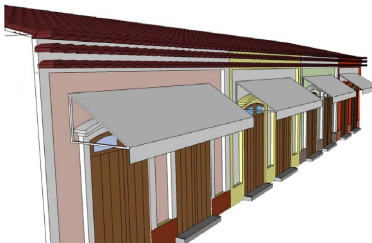
Fig. 2 – Perspectiva esquemática

Esses parâmetros estão sujeitos a alteração, e poderão ser revisados de acordo com o andamento do trabalho “Normatização para intervenções no Conjunto Histórico e Paisagístico de Iguape”.